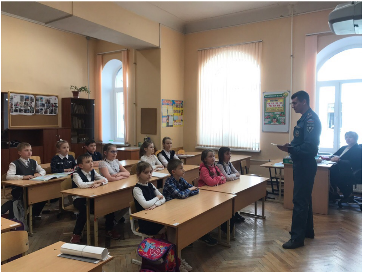
ОНДПР Центрального района ГУ МЧС России по Санкт-Петербургу 20.05.19