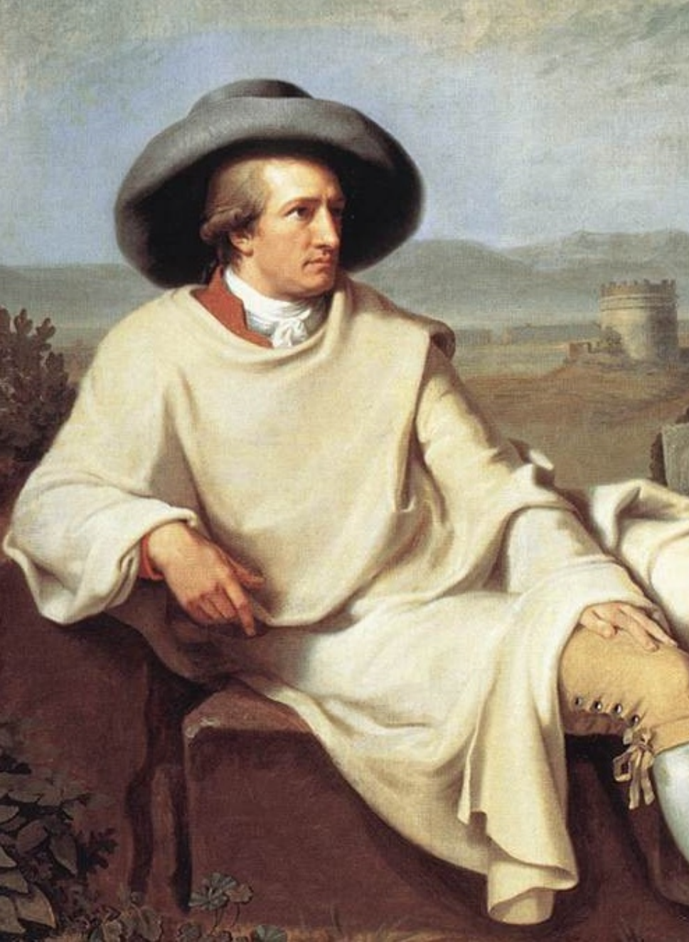
Иоганн Вольфганг фон Гёте