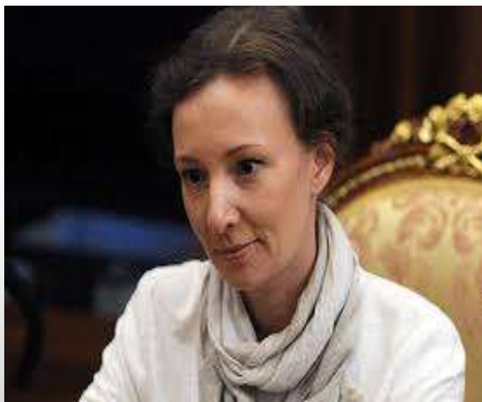
Анна Юрьевна Кузнецова

Следят за соблюдением Конвенции специальные люди – Уполномоченные по правам ребёнка, которые есть не только в столицах, но и в разных городах каждой страны. Так что, в любой момент, тебе есть кому заявить о нарушении твоих законных прав!